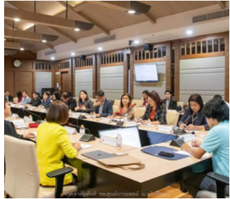
ประธานาธิบดี จ.ศูนย์การแพทย์ วลัยลักษณ์