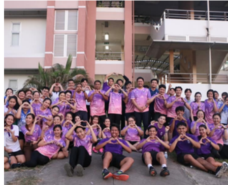
สาธารณสุขศาสตร์